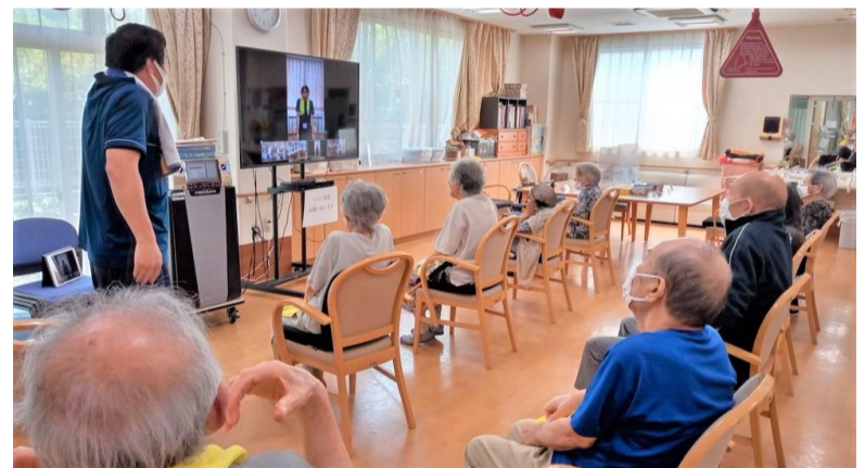
② まずは軽い準備体操

① まずは今回の講師「あずみ苑上尾 池上先生」の挨拶からスタート！ 他の施設の皆さんの映像も観れるようになっています👁👁